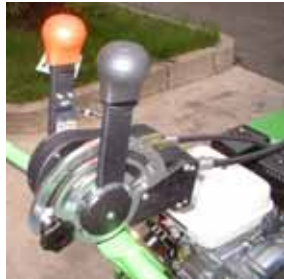
Sólidos mandos de la transmisión y siembra